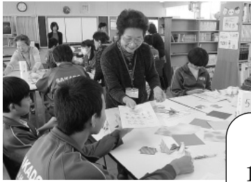
お楽しみ工房「折り紙」