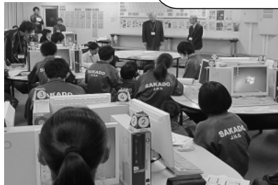
ワードで自己紹介カード作り