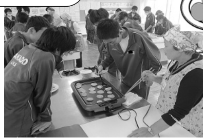
「たらし焼き」 伝承食