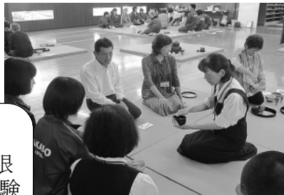
お茶でおしゃべり