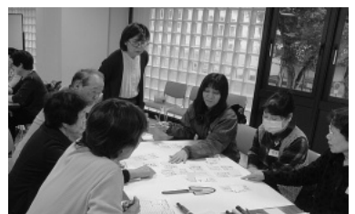
第2日目(参加者48名) 「自分を知ろう・地域を知ろう」のグループワークで様々な気づき、アイデアが出ました。