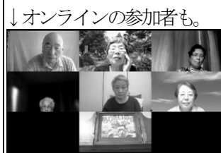
↓オンラインの参加者も。

6月12日(月)は、坂戸市福祉センターで、紙芝居ボランティア「あじさいの会」による紙芝居の上演会でした。 「つばめのおんがえし・貧乏神と福の神・さら屋敷のおきく・へっこき嫁・小僧さんのお経」と豪華なラインナップ！ 間に歌や体操もはさみ、あじさいの会の巧みな話術と進行に感心したり大笑いしたり。初参加の方、そして、久しぶりの方も多く、楽しいひとときになりました。