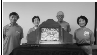
↑あじさいの会の皆さん